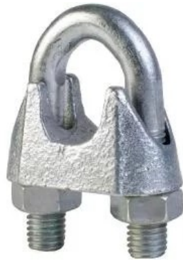
Lote 1 Item 4